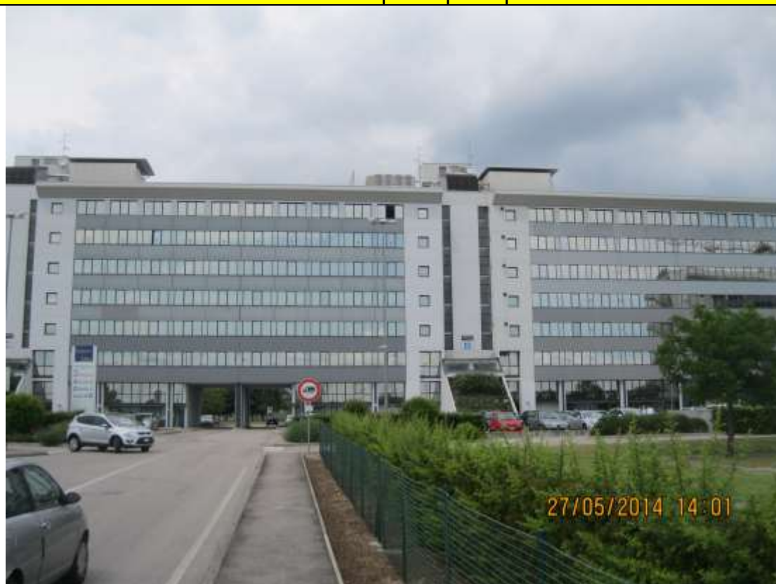
FOTO 4 Prospetto principale-