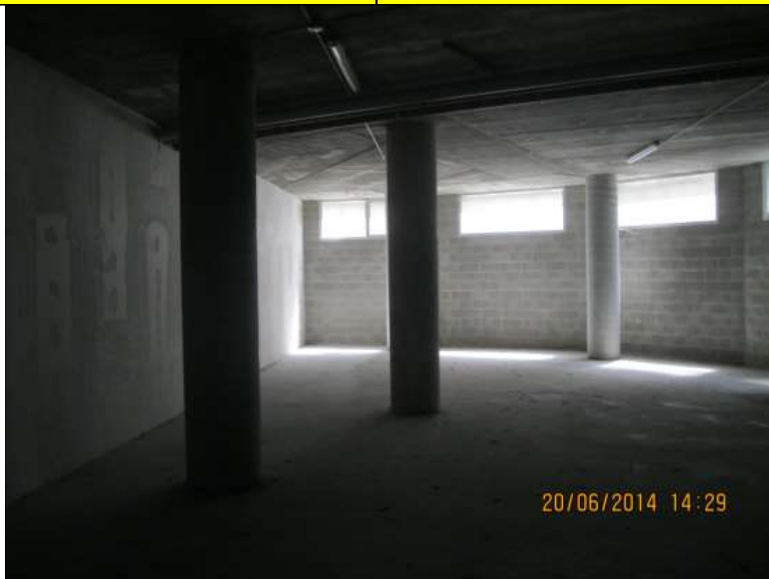
FOTO 2 Deposito sub 140