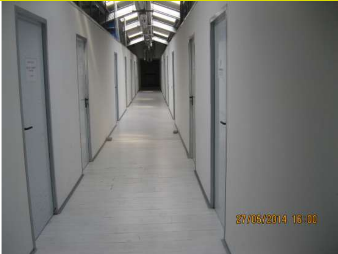
FOTO 6 Corridoio comune depositi-