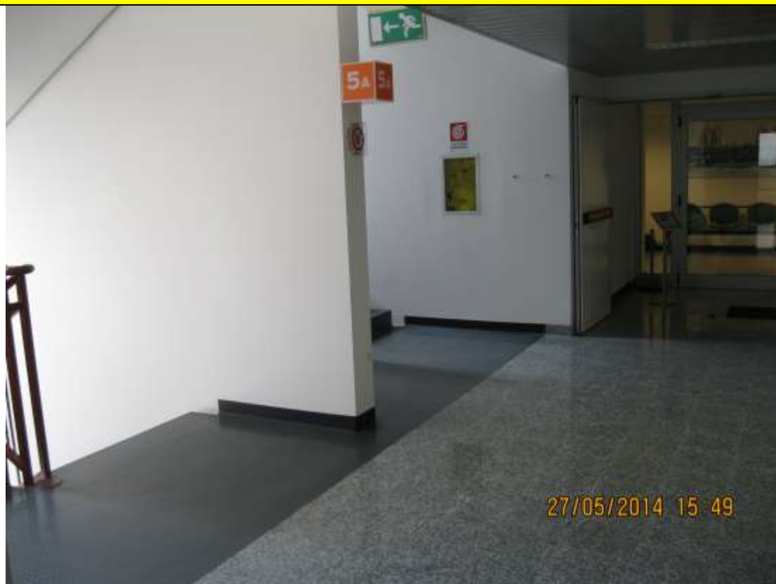
FOTO 6 Parti comuni-