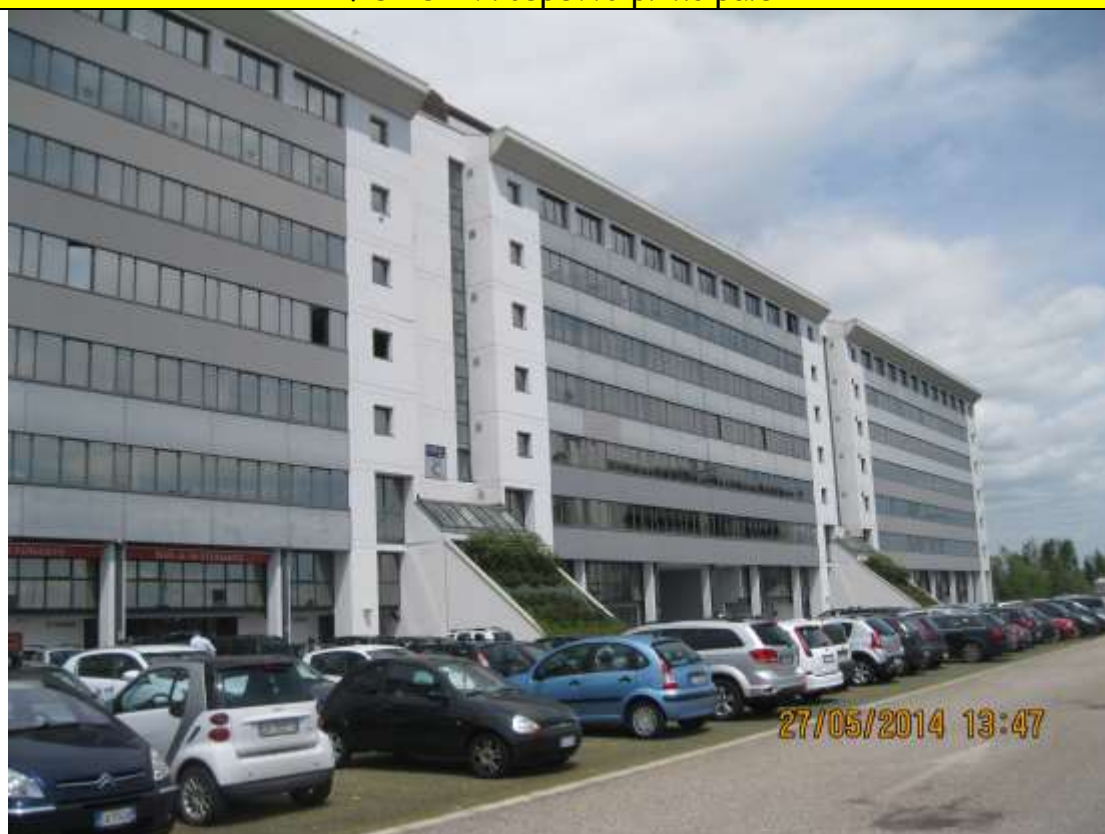
FOTO 2 Prospetto principale-